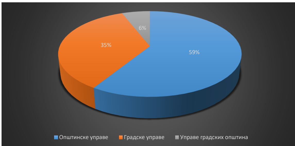
Графикон 1. – Однос датих мишљења без примедби према подносиоцу захтева

Начелна оцена Савета је да припрема, развој и доношење наведених програма обуке доприноси остваривању укупних циљева реформе стручног усавршавања у јединицама локалне самоуправе, те да ће њихово спровођење допринети унапређењу знања и вештина запослених на појединим радним местима или врсти послова из изворног делокруга и надлежности јединице локалне самоуправе.