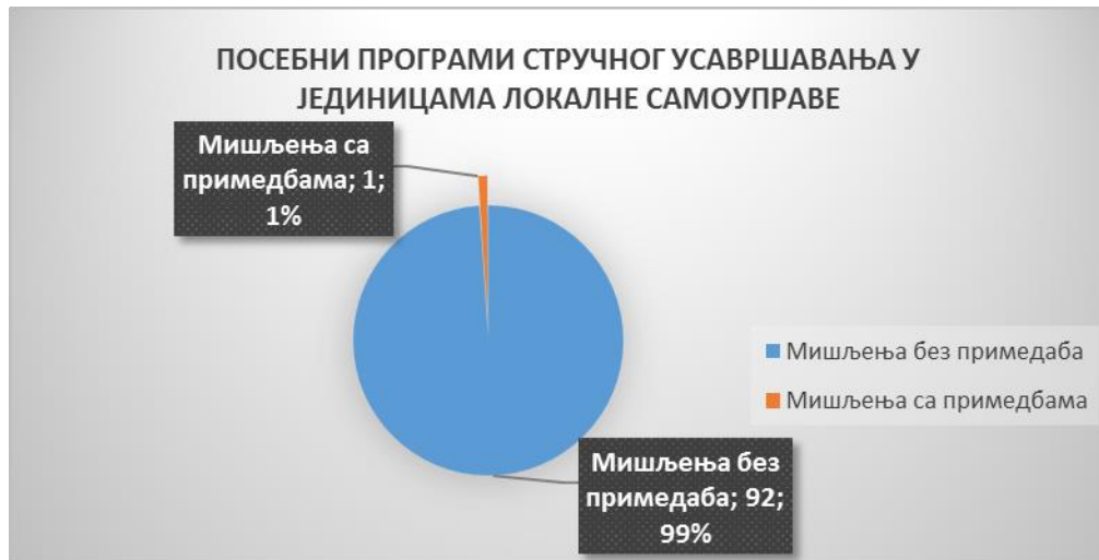
Графикон 1. – Однос броја мишљења без примедба и мишљења са примедбама

Сагласно члану 119. став 1. тачка 6) Закона, поводом захтева надлежних органа јединица локалне самоуправе за прибављање мишљења, Савет је разматрао 93 предлога посебних програма стручног усавршавања у јединицама локалне самоуправе из члана 122в став 1. тачка 2. Закона.