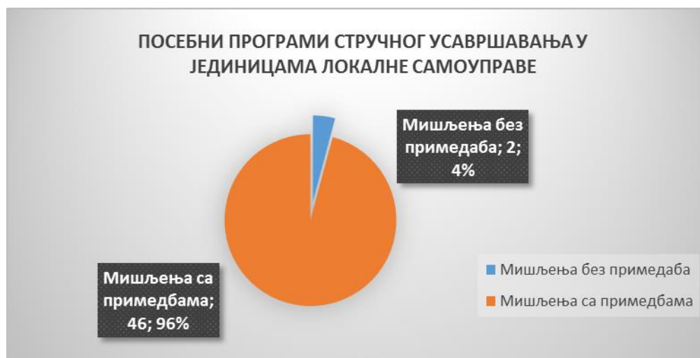
Графикон 1. – Однос броја мишљења без примедба и мишљења са примедбама

Такође, Савет је дао и два мишљења, са примедбама о предлозима посебних програма стручног усавршавања запослених у управама градских општина (града Ниша) Нишка Бања и Палилула, уз образложени предлог о начину усаглашавања предлога програма са прописима који уређују ову материју.