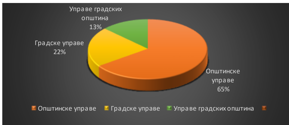
Графикон 1. – Процент датих мишљења без примедба према подносиоцу захтева

Такође, Савет је дао и два мишљења, са примедбама о предлозима посебних програма стручног усавршавања запослених у управама градских општина (града Ниша) Нишка Бања и Палилула, уз образложени предлог о начину усаглашавања предлога програма са прописима који уређују ову материју.