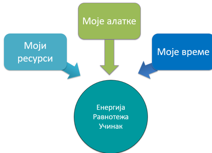
Слика 4: визуелна представа концепта модула

Средишња идеја модула јесте да истражи, разуме и изнађе начине да унапреди три главна извора личне продуктивности – индивидуални ресурси, релевантни алати и технике и време. Индивидуални ресурси подразумевају сопствене јаке стране, предности и капацитете – ум, тело, начин како особа функционише, када је највише односно најмање ефикасна и којих аспеката ресурса особа није у потпуности свесна. Алати и технике су практични начини како се управља стресом, како се јача унутрашња контрола и одржава унутрашња равнотежа. И коначно, вештине управљања временом и дотични алати помажу да се на најбољи начин искористи време проведено на послу. Као резултат тога, особа има више енергије, бољу равнотежу и има бољи учинак у улози државног службеника на положају.