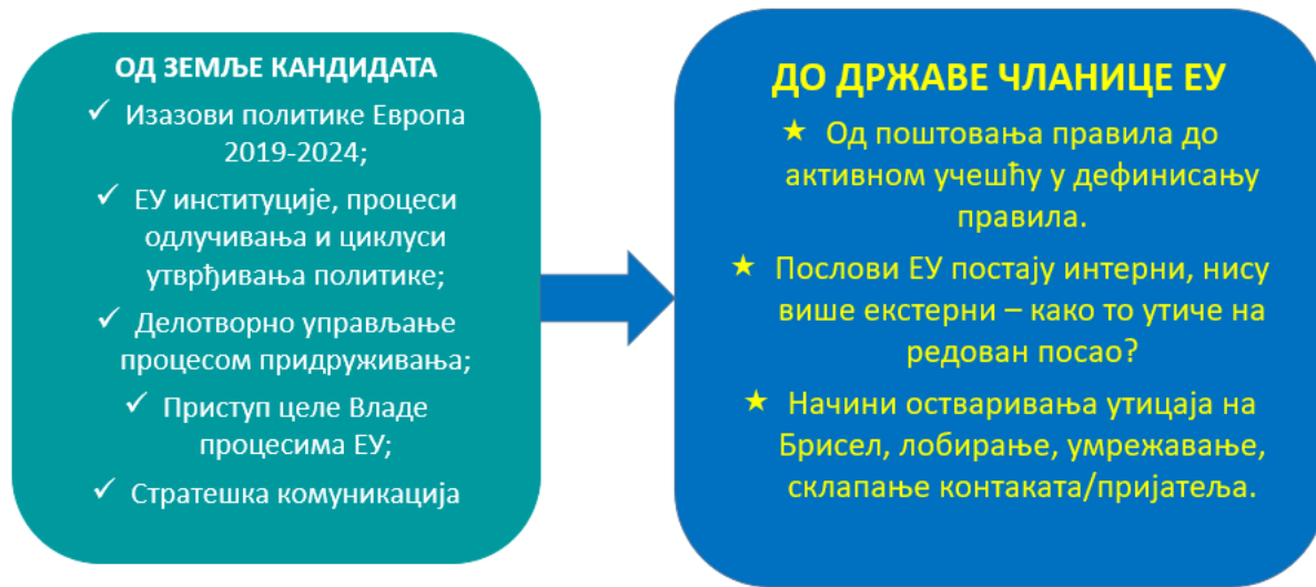
Слика 7: визуелна представа концепта модула

Средишња идеја овог модула јесте да прошири видике учесника и њихово разумевање суштине фундаменталне трансформације из статуса земље кандидата у статус државе чланице ЕУ. Овај модул проводи полазнике кроз путовање у будућност да би разумели дубину промене и да би направили везу између своје улоге државног службеника на положају и предвођења промене у својој области.