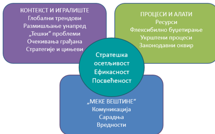
Слика 2: визуелна представа концепта модула

Средишња идеја модула јесте да свеобухватно обогати учеснике модерним промишљањем стратегије и да им пружи одговарајуће алате за стратешки процес, повезујући стратегију са ресурсима из перспективе ефикасности. Стратегија је алат модерног лидера за кога је неопходно да усвоји „меке“ вештине којима ће стратегији удахнути живот.