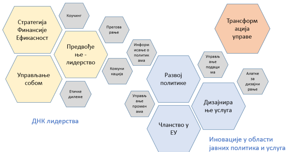
Слика 1. Концепт пчелињег саћа програма усавршавања за државне службенике на положајима

модул за веома напредне државне службенике на положају који су већ похађали већину других модула или који би желели да се усредсреде на трансформацију управљања као кључни приоритет у свом раду.