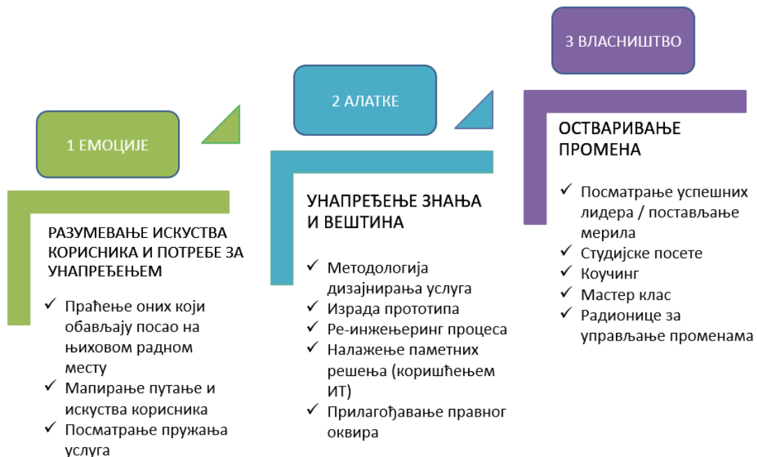
Слика 6: визуелна представа концепта модула

Средишња идеја овог модула јесте да прати размишљање о креирању модернизованих јавних услуга. Прва фаза се односи на емоције да би се разумело искуство корисника и потребе за модернизацијом. Друга фаза је откривање и коришћење алата за дизајнирање услуга ради унапређења услуга. А трећа фаза је преузимање власништва у улози највишег руководиоца за спровођење ових идеја са циљем да се унапређене услуге преточе у реалност.