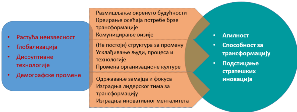
Слика 8: визуелна представа концепта модула