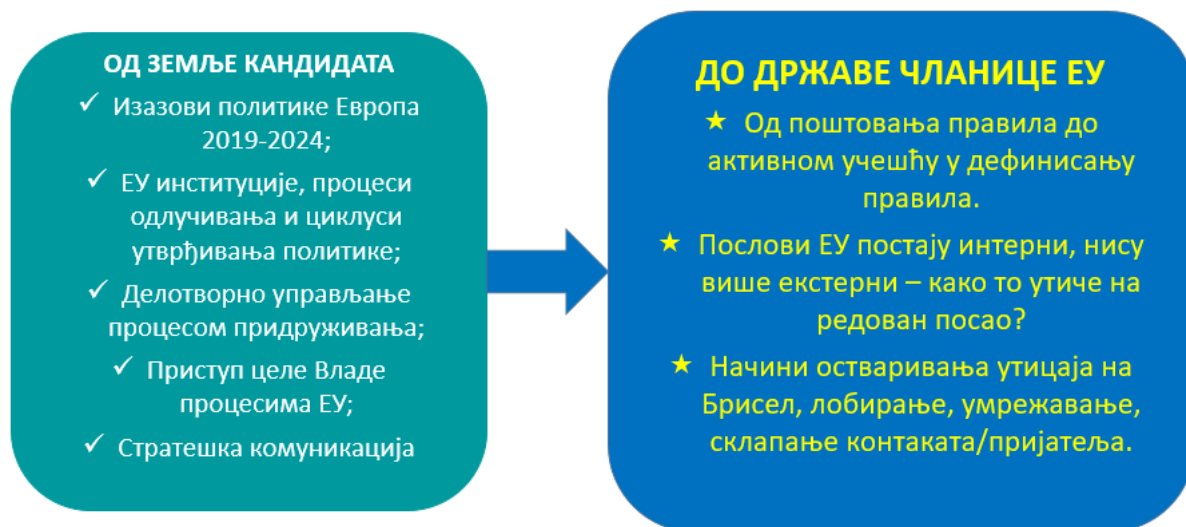
Слика 7: визуелна представа концепта модула

Средишња идеја овог модула јесте да прошири видике учесника и њихово разумевање суштине фундаменталне трансформације из статуса земље кандидата у статус државе чланице ЕУ. Овај модул проводи полазнике кроз путовање у будућност да би разумели дубину промене и да би направили везу између своје улоге државног службеника на положају и предвођења промене у својој области.