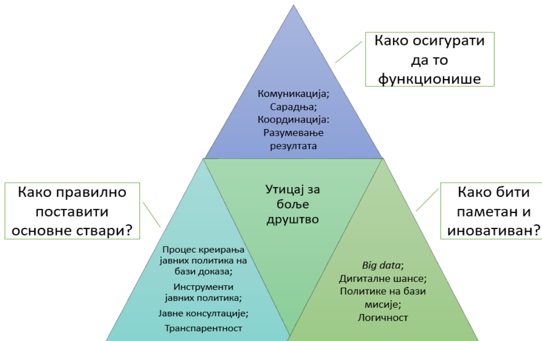
Слика 5: визуелна представа концепта модула