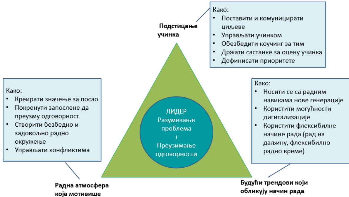
Слика 3: визуелна представа концепта модула