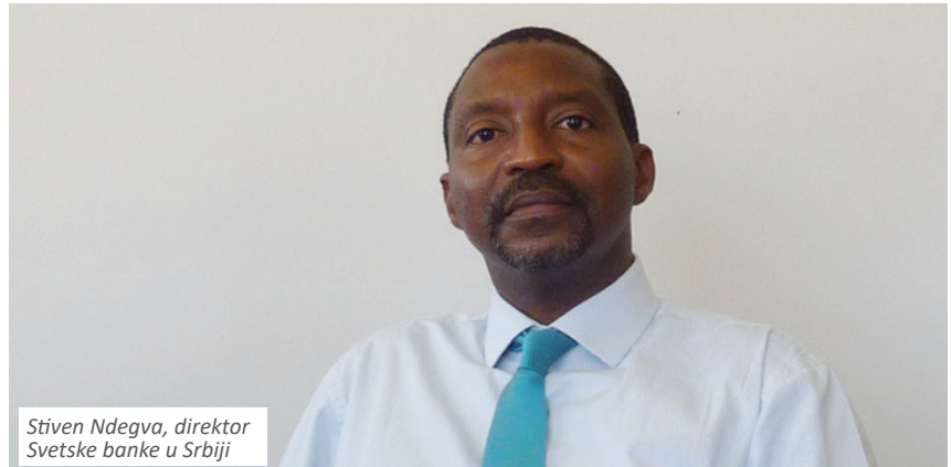
Stiven Ndegva, direktor Svetske banke u Srbiji

Horizontalna funkcionalna analiza, koja je obuhvatila 94 institucije na centralnom nivou državnog uređenja zajedno sa pripadajućim organima iz svakog resora, pokazala je da je državna administracija opterećena velikim brojem institucija kojima se preklapaju nadležnosti, velikim brojem rukovodioca i zaposlenih