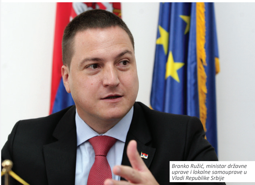
Branko Ružić, ministar državne uprave i lokalne samouprave u Vladi Republike Srbije

Zato da, pre svega, zajedno demistifikujemo stereotipe koji nam se uporno nameću kroz medije i unapred dezavuišu svrshishodnost reformi u javnoj upravi i njen značaj za napredak i modernizaciju društva u Srbiji. Na primer: